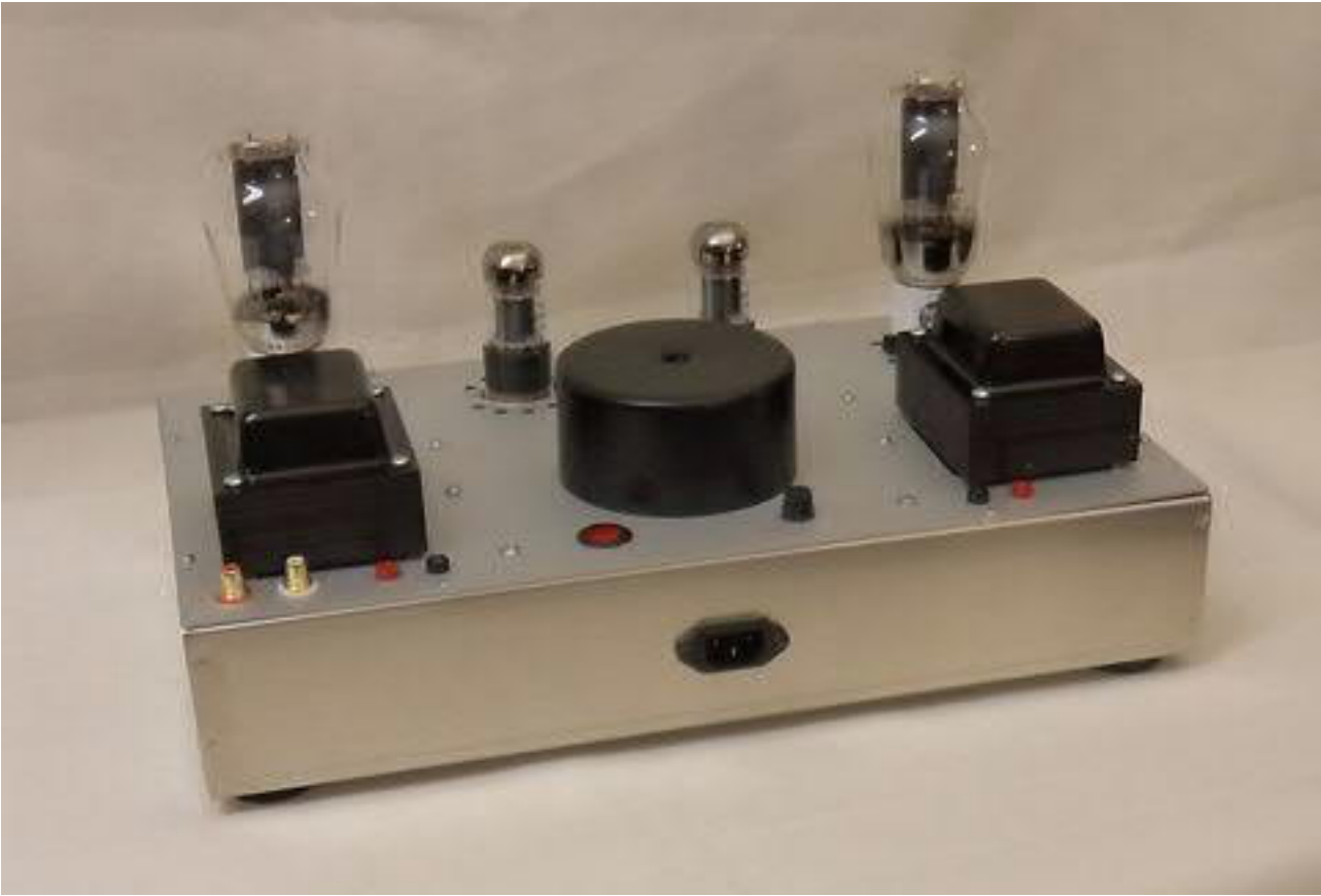
Das nächste Bild zeigt die klassische Handverdrahtung der Endstufe